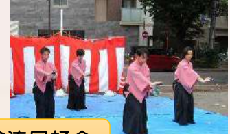
東村山新陰流同好会