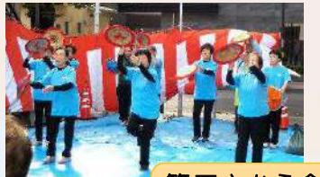
第二さかえ会 八坂寿会