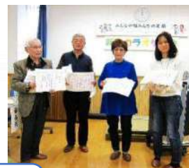
2023年開催 出演者の皆さん