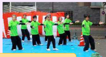
健身サークルさかえ