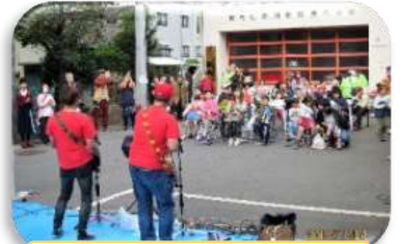
秋祭りを楽しんでいる様子