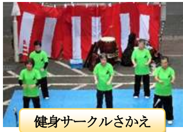
健身サークルさかえ

イベント出演の方々の演技はどれも素晴らしかったです。また、模擬店も焼とり、焼そば、綿あめ等、好調な売れ行きでした。最後にビンゴゲームで大いに盛り上がりました。