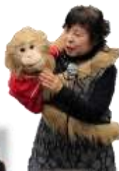
昨年の秋まつりの様子