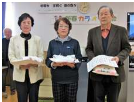
昨年、第12回の入賞者の皆さん