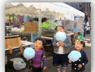
綿あめ、おいしいよ!