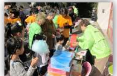
何が当たるか、抽選会