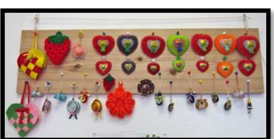
手芸作品 (当センターに展示中)