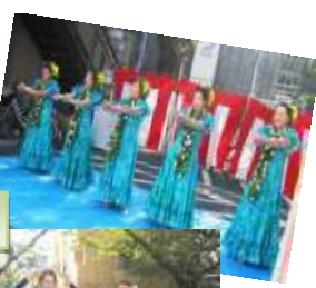
ブーゲンビレア萩山