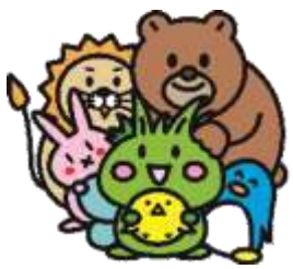
平成30年4月～8月 利用件数

日頃より、沢山の皆様に当センターをご利用いただいています。平成30年4月より8月までの施設利用状況です。 皆様の活動日程の参考にしていただき、効率的なご利用をお願いします。