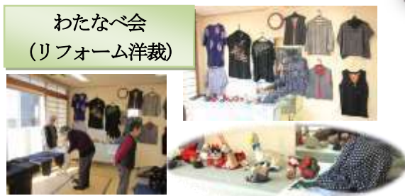
わたなべ会 (リフォーム洋裁)