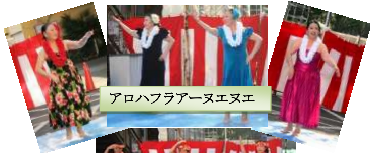
アロハフラアーヌエヌエ