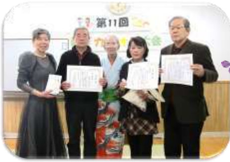
昨年、第11回の入賞者の皆さん