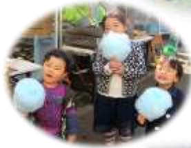
昨年の秋まつりの様子