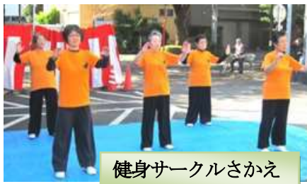
健身サークルさかえ