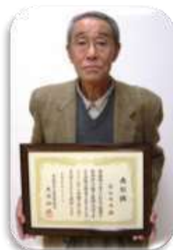
本柳栄町町会長 と表彰状