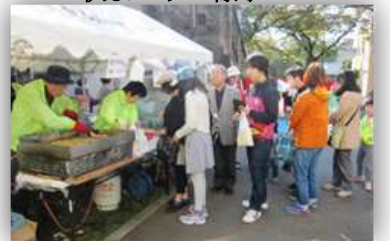
焼きそばを求めて長〜い列