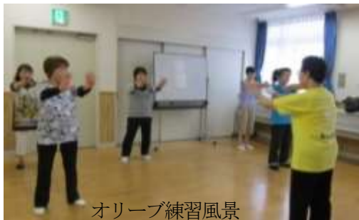
オリーブ練習風景