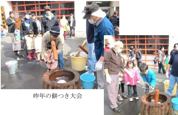
昨年の餅つき大会