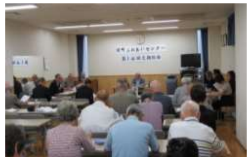
栄町ふれあいセンター 定期総会が終わって