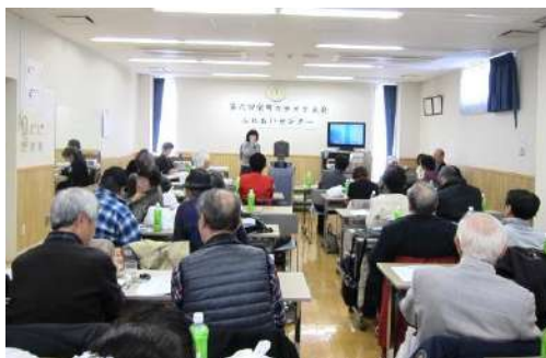
昨年新春カラオケ大会

声を出すことは体にとても良いことです。 初めて参加される方、大いに歓迎いたします。