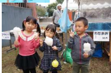
昨年の秋まつりの模様