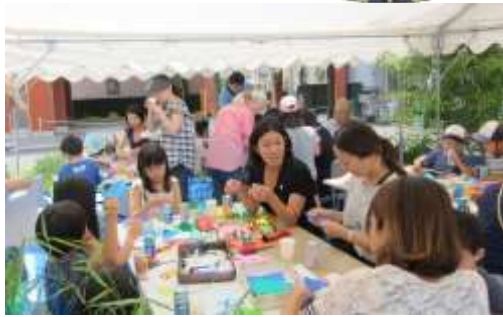
大人も子供も願いを書いて