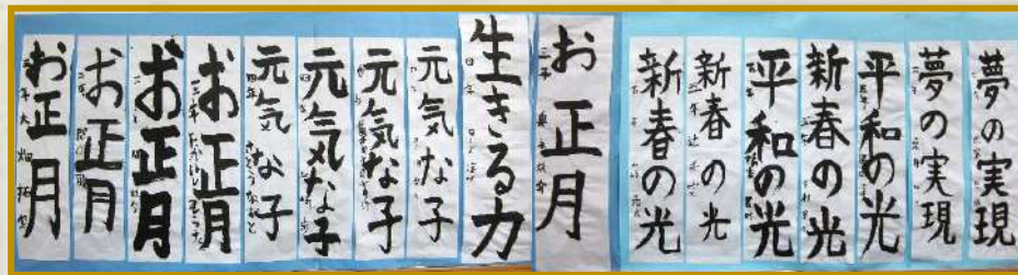
心のこもった力作です。