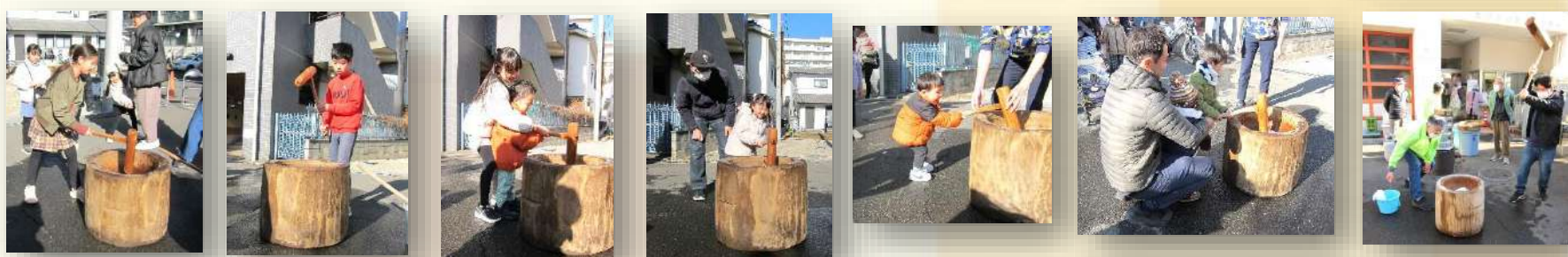
一緒に力を合わせ、笑顔もはずむ餅つき日和！