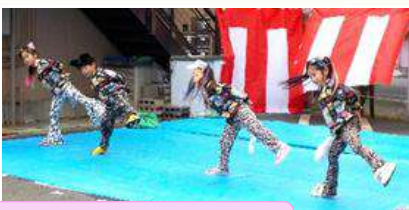
音色ダンススタジオ