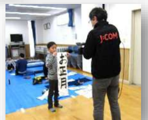
インタビューの様子