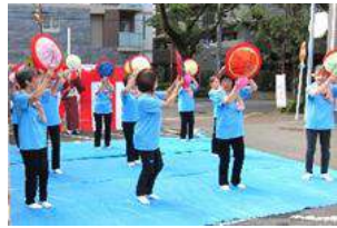
第二さかえ会 八坂寿会