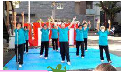
健身サークルさかえ