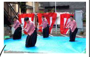
東村山新陰流同好会